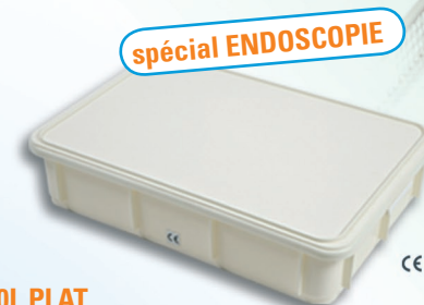
INSTRUBAC 20L PLAT Version simple, avec ou sans robinet