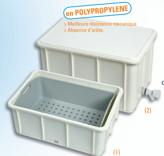
INSTRUBAC 40 (1) et 60L (2) EN POLYPROPYLENE Version simple, avec ou sans robinet