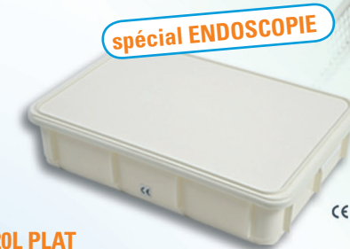
INSTRUBAC 20L PLAT Version simple, avec ou sans robinet