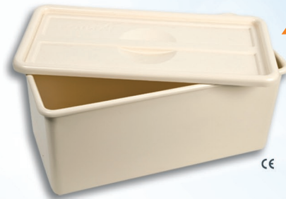
INSTRUBAC 20L Version simple sans robinet