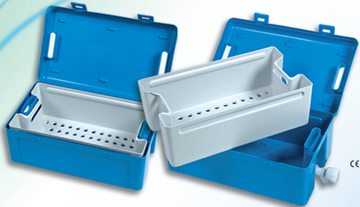
INSTRUBAC 20L Version simple, avec ou sans robinet

Bacs de trempage pour le ramassage de l'instrumentation souillée