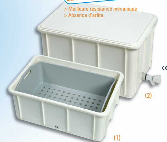
INSTRUBAC 40 (1) et 60L (2) EN POLYPROPYLENE Version simple, avec ou sans robinet