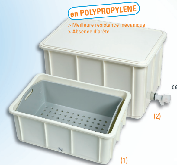
INSTRUBAC 40 (1) et 60L (2) EN POLYPROPYLENE Version simple, avec ou sans robinet